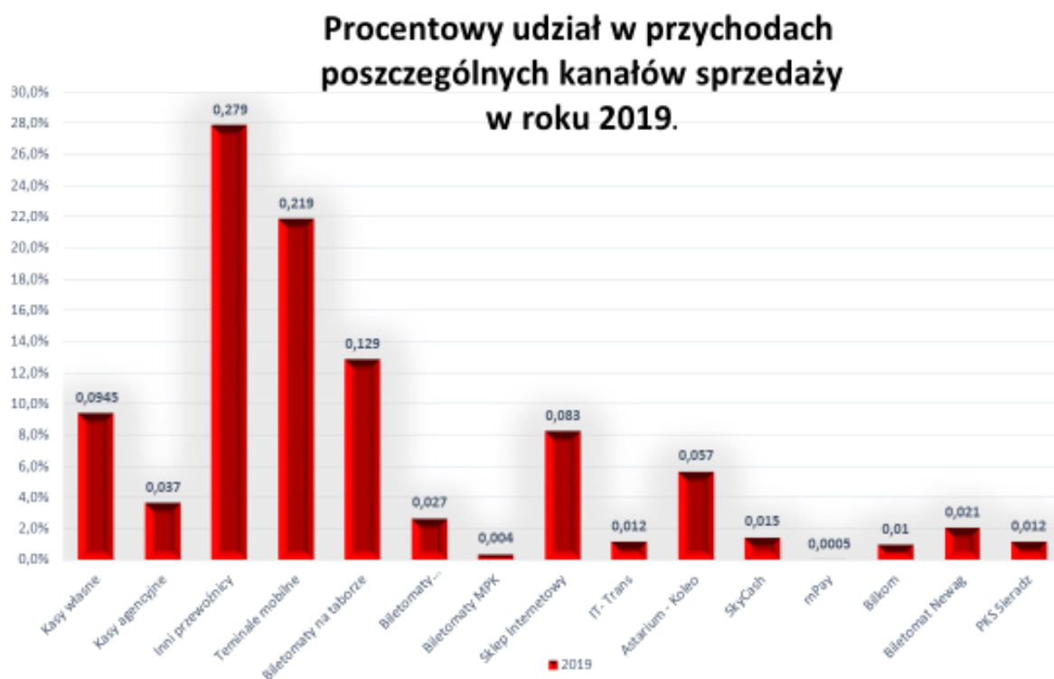
Tabela. Kanały dystrybucji biletów

Od marca 2018 wdrożony został projekt sprzedaży biletów w Koleo na przejazdy jednorazowe wraz ze wskazaniem miejsca do siedzenia w pociągach kategorii ŁKA Sprinter (ŁS) kursujących w relacji Łódź Fabryczna – Warszawa Wschodnia – Łódź Fabryczna.