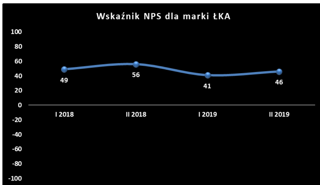
Tabela. Wskaźnik NPS (Net Promoter Score) – wskaźnik polecalności/lojalności klientów

W roku 2019 dał się zauważyć trend spadkowy w ocenie pasażerów, który spowodowany jest głównie przez szereg utrudnień związanych z remontami infrastruktury prowadzonymi na terenie województwa łódzkiego. Wskaźnik polecalności dla marki „ŁKA” sp. z o.o. nadal utrzymuje się na bardzo wysokim poziomie, co pokazuje poniższe porównanie.